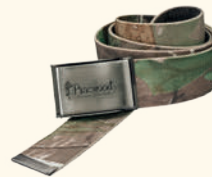
8199 PINWOOD® CAMOU CANVAS BELT XTRA (930)