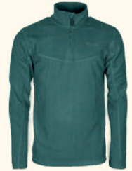
5069 TIVEDEN FLEECE SWEATER M'S GREEN (100), MID KHAKI (248), ATLANTIC BLUE (374), BLACK (400)