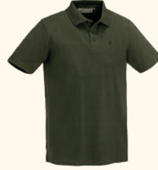
5460 PINWOOD® VÄRNAMO POLO SHIRT M'S MOSS GREEN (135)