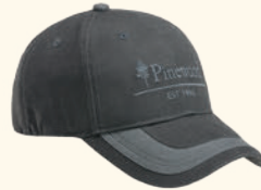
9194 PINWOOD® TC 2-COLOUR CAP MOSS GREEN (135), D.ANTHRACITE (443), H.OLIVE (713)