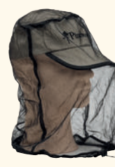
9378 PINewood® MOSQUITO NET BLACK (400)