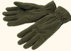
9407 PINWOOD® SAMUEL FLEECE GLOVE H.GREEN (114), BLACK (400)