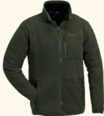
6065 FINNVEDEN FLEECE JACKET K'S GREEN (100)