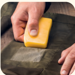
4600 WATER REPELLENT WAX