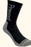
9212 PINWOOD® COOLMAX® MEDIUM 2 - PACK SOCKS GREEN (100), BLACK (400)