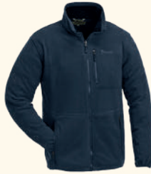
5065 FINNVEDEN FLEECE JACKET M'S D.NAVY (314), GREEN (100), BLACK (400)