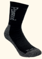
9213 PINWOOD® THERMOLITE® SOCKS BLACK (400)