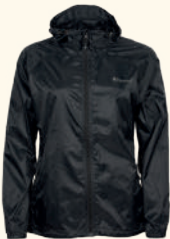
3308 FINNVEDEN WINDBLOCKER JACKET W'S GREEN (100), BLACK (400)