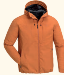
5213 ABISKO/TELLUZ 3L JACKET M'S MOSS GREEN (135), BURNED ORANGE (501), D.ANTHRACITE (443)