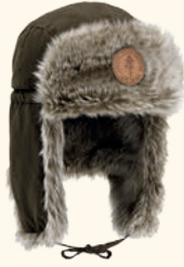
9420 PINWOOD® MURMANSK HAT SUEDE BROWN (241)