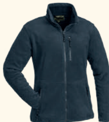
3065 FINNVEDEN FLEECE JACKET W'S D.NAVY (314), GREEN (100), BLACK (400)