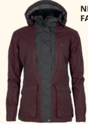
3183 PINEWOOD® DOG SPORTS 2.0 JACKET W'S EARTHPLUM/D.ANTHRACITE (817), MOSSGREEN/BLACK (153), BLACK/D.ANTHRACITE (407)