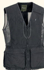
5184 PINWOOD® DOG SPORTS 2.0 VEST M'S MOSS GREEN (135), SUEDE BROWN/ D.OLIVE (244), BLACK/ D.ANTHRACITE (407)