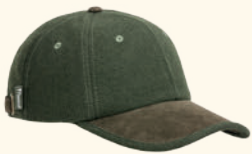
1119 PINWOOD® EDMONTON EXCLUSIVE CAP MOSSGREEN/ SUEDE BROWN (182)