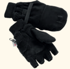
9109 PINWOOD® HUNTING/ FISHING GLOVE H.GREEN (114), BLACK (400)