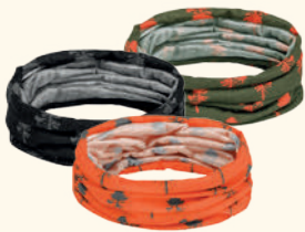
5896 PINWOOD® OUTDOOR 3P HEAD SCARF MIX (000)