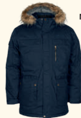
5246 FINNVEDEN WINTER PARKA M'S D.OLIVE (128), D.NAVY (314), BLACK (400)