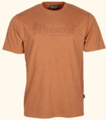
5445 PINWOOD® OUTDOOR LIFE T-SHIRT M'S D.GREEN (103), D.NAVY (314), L.TERRACOTTA (514), D.ANTHRACITE (443), H.OLIVE (713)