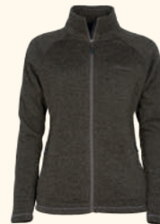
9372 PINWOOD® GABRIELLA KNITTED JACKET W'S PLUM MEL (586), OLIVE MEL (148)