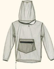
9280 PINewood® MOSQUITO COVER ANORAK OLIVE (107)