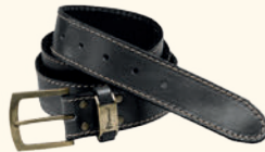
5197 PINWOOD® PRESTWICK BELT BROWN (205), BLACK (400)