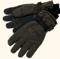
9411 PINWOOD® MEMBRANE GLOVE MOSS GREEN (135), SUEDE BROWN (241)