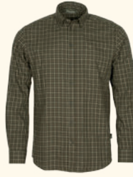
5533 NYDALA GROUSE SHIRT M'S MOSS GREEN (135), OFFWHITE/GREEN (605)