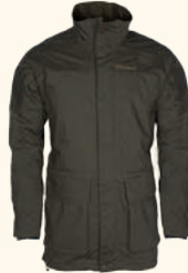
5394 PINWOOD® WILDMARK EXTREME JACKET M'S D.OLIVE (128)