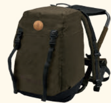
1919 PINEWOOD® HUNTING CHAIR BACKPACK K'S SUEDE BROWN (241)