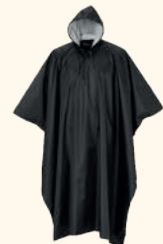
9661 PINewood® RAINFALL PONCHO GREEN (100), BLACK (400)