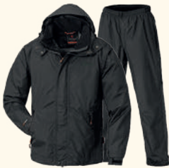
9862 PINewood® TORNADO EXTREME RAIN SET GREEN (100), BLACK (400)