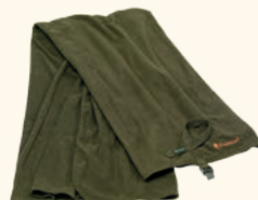
9108 PINWOOD® COMFY FLEECE BLANKET H.GREEN (114)