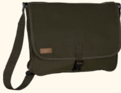
1912 PINWOOD® DOG SPORTS SHOULDER BAG MOSS GREEN (135)