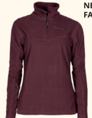
3069 TIVEDEN FLEECE SWEATER W'S EARTH PLUM (815), GREEN (100), MID KHAKI (248), BLACK (400)