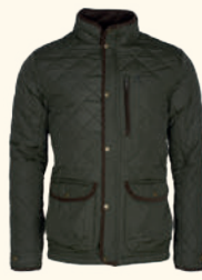
5815 NYDALA CLASSIC QUILT JACKET M'S MOSS GREEN (135)