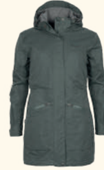
3181 PINEWOOD® WILDA PARKA W'S URBAN GREY (460), EARTH PLUM (815), MOSS GREEN (135), BLACK (400)