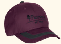
1146 PINEWOOD® TC 2-COLOUR CAP K'S MOSS GREEN (135), D.ANTHRACITE (443), H.OLIVE (713), PLUM/D. ANTHRACITE (582), FUSCHIA/D. ANTHRACITE (818)