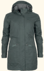
3181 PINWOOD® WILDA PARKA W'S URBAN GREY (460), EARTH PLUM (815), MOSS GREEN (135), BLACK (400)