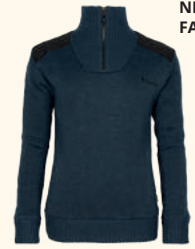
9349 PINWOOD® HURRICANE SWEATER W'S D.NAVY MEL (378), D.BURGUNDY MEL (563), D.GREEN MEL (142), D.GREY MEL (423)