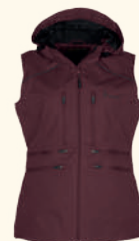
3180 PINWOOD® DOG SPORTS WINDBLOCKER VEST W'S URBAN GREY (460), EARTH PLUM (815), MOSS GREEN (135), BLACK (400), MARRON ROSE (597)