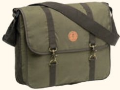
1911 PINWOOD® SHOULDER BAG H.OLIVE (713)