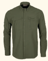
5342 EVERYDAY TRAVEL L/S SHIRT M'S GREEN (100), SAND (200)