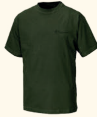
9447 PINWOOD® 2-PACK T-SHIRT M'S GREEN (100)