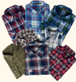
5325 PINWOOD® LUNDSBO SHIRT M'S MIX (000)