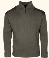
9547 PINWOOD® NEW STORMY SWEATER M'S BROWN MEL (207)