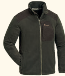
5066 PINWOOD® WILDMARK MEMBRANE FLEECE JACKET M'S H.BROWN/SUEDE BROWN (242)