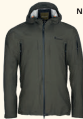
5200 ABISKO PATHFINDERS 3L JACKET M'S URBAN GREEN (751)