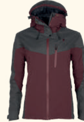
3300 FINNVEDEN HYBRID EXTREME JACKET W'S EARTHPLUM/D.ANTHRACITE (817), D.DIVE (349), D.OLIVE/H.OLIVE (723), BLACK/D. ANTHRACITE (407), RED/D.TOMATO (576)