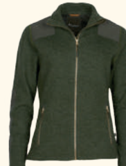
3396 PINWOOD® LAPPLAND FELTED WOOL JACKET W'S GREEN MEL (116), D.GREY MEL (423)