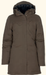
3414 PINWOOD® VÄRNAMO PADDED JACKET W'S EARTH BROWN (206), D.GREEN (103), SMOKE BLACK (437)