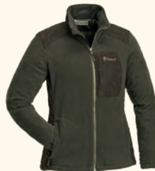
3066 PINWOOD® WILDMARK MEMBRANE FLEECE JACKET W'S H.BROWN/SUEDE BROWN (242)