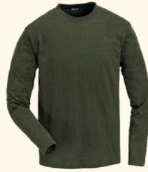
7447 PINWOOD® LONG SLEEVE 2-PACK T-SHIRT M'S GREEN (100)