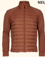
5241 FINNVEDEN HYBRID POWER FLEECE JACKET M'S DUSTY BROWN (266), BLACK (400), TERRACOTTA (524)