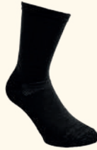
9210 PINWOOD® COOLMAX® LINER 2 - PACK SOCKS GREEN (100), BLACK (400)