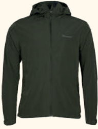
5317 FINNVEDEN TRAIL STRETCH JACKET M'S D.GREEN (103), BLACK (400)