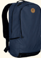
1913 PINWOOD® DAY PACK 22L D.OLIVE (128), MID GREEN (137), D.NAVY (314), BLACK (400)