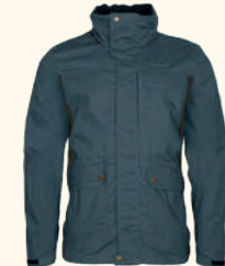
5314 FINNVEDEN TRAIL HYBRID JACKET M'S D.STORM BLUE/D.GREEN (375), D.ANTHRACITE/BLACK (446), D.OLIVE/EARTHBROWN (749)