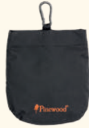
1123 PINEWOOD® DOG SPORTS CANDY BAG BLACK (400)