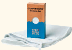
1107 GUPPYFRIEND WASHING BAG WHITE (600)