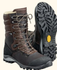
9934 PINEWOOD® HIGH HUNTING & HIKING BOOT BROWN (205)