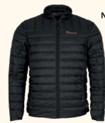
5159 ABISKO INSULATION LITE JACKET M'S BLACK (400), CLOVER GREEN (735)