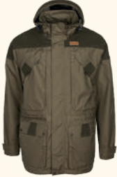
5390 PINWOOD® LAPPLAND EXTREME 2.0 JACKET M'S MOSSGREEN/BLACK (153), H.OLIVE MOSSGREEN (734), D.ANTHRACITE/ BLACK (446)