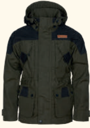
6390 PINEWOOD® LAPPLAND EXTREME 2.0 JACKET K'S MOSSGREEN/ BLACK (153)