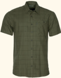
5424 VÄRNAMO HEMP S/S SHIRT M'S GREEN (100)