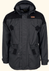
5390 PINewood® LAPPLAND EXTREME 2.0 JACKET M'S MOSSGREEN/BLACK (153), H.OLIVE/MOSSGREEN (734), D.ANTHRACITE/BLACK (446)