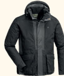
5183 PINEWOOD® DOG SPORTS 2.0 JACKET M'S MOSSGREEN/BLACK (153), BLACK/D.ANTHRACITE (407)