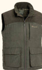
5883 PINWOOD® ABISKO VEST M'S SUEDE BROWN (241)