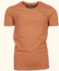
6445 PINEWOOD® OUTDOOR LIFE T-SHIRT K'S L.TERRACOTTA (514), H.OLIVE (713)