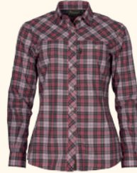
9328 PINEWOOD® CUMBRIA SHIRT W'S PINK/GREY (812)