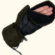
1150 PINewood® HUNTERS PRO GLOVE MOSS GREEN (135)