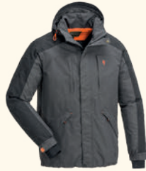
5060 PINewood® BOLMEN FISHING JACKET M'S GREEN/D.GREEN (104), D.ANTHRACITE/BLACK (446)