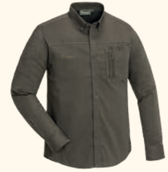
5016 TIVEDEN TC-STRETCH NATURESAFE SHIRT M'S L.KHAKI (224), D.OLIVE/SUEDE BROWN (186)