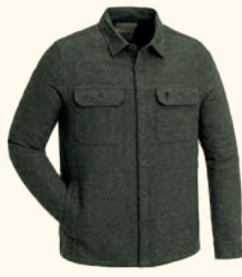
5005 PINWOOD® VÄRNAMO OVERSHIRT M'S D.GREEN MEL (142)