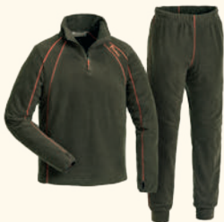
5062 PINWOOD® COMFY MICROFLEECE SET M'S H.GREEN (114)