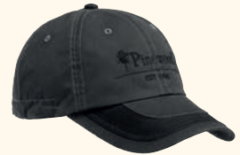
9195 PINWOOD® EXTREME CAP MOSS GREEN (135), D.ANTHRACITE/BLACK (446)