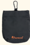
1123 PINWOOD® DOG SPORTS CANDY BAG BLACK (400)