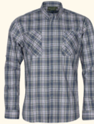
5337 PINWOOD® GLENN SHIRT M'S BLUE/GREY (341)