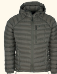
5152 ABISKO INSULATION JACKET M'S D.MOLE BROWN (260), SMOKE BLACK (437), CLOVER GREEN (735)