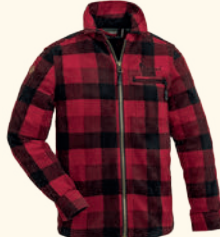
6069 PINEWOOD® CANADA FLEECE SHIRT K'S RED/BLACK (518)