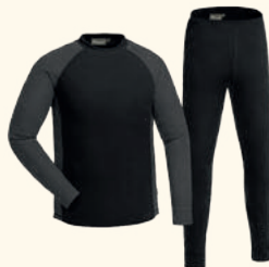
5408 FINNVEDEN BASE LAYER M'S BLACK/D.GREY (415), D.GREEN/LEAF (740)