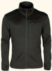
5775 FURUDAL/FRAZER ACTIVE POWER FLEECE M'S D.MOSSGREEN (733)