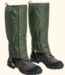
1102 PINWOOD® ACTIVE GAITERS MOSS GREEN (135)