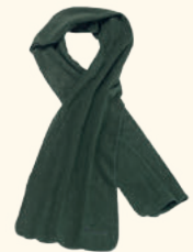
9102 PINWOOD® MICROFLEECE SCARF GREEN (100),