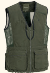
5184 PINEWOOD® DOG SPORTS 2.0 VEST M'S MOSS GREEN (135), L.KHAKI (224), SUEDE BROWN/D.OLIVE (244), BLACK/D.ANTHRACITE (407)