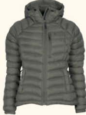
3152 ABISKO INSULATION JACKET W'S D.MOLE BROWN (260), SMOKE BLACK (437), MARRON ROSE (597), CLOVER GREEN (735)