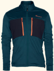
5209 ABISKO POWER FLEECE JACKET M'S MOSS GREEN (135), D.ATLANTIC BLUE (377), BLACK (400), URBAN GREY (460)