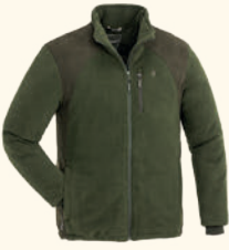
5064 PINWOOD® HARRIE FLEECE JACKET M'S GREEN/SUEDEBROWN (724)