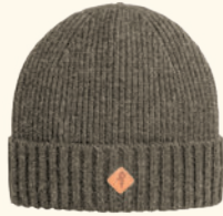
1121 PINWOOD® KNITTED WOOL HAT MOLE MEL (234), STORM BLUE MEL (364), RUSTY PINK MEL (594), MOSSGREEN MEL (194), D.ANTHRACITE MEL (449)