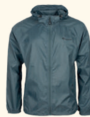
5308 FINNVEDEN WINDBLOCKER JACKET M'S GREEN (100), D.STORM BLUE (366), BLACK (400)