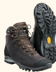
9935 PINEWOOD® MID HUNTING & HIKING BOOT BROWN (205)