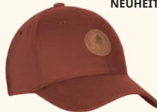
1142 FINNVEDEN HYBRID CAP L.KHAKI (224), D.DIVE (349), BLACK (400), TERRACOTTA (524), D.OLIVE/H. OLIVE (723), MARRONROSE/D.ANTHRAC (802), D.TOMATO/D.RED (816), EARTHPLUM/D.ANTHRACITE (817)