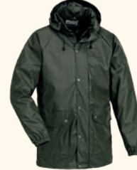
5001 PINewood® GREMISTA RAIN JACKET M'S GREEN (100)