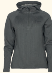
3516 EVERYDAY TRAVEL HOODIE W'S D.GREEN MEL (142), GREY MEL (408)