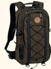
5498 PINWOOD® 22L OUTDOOR BACKPACK SUEDE BROWN (241)