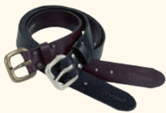
9197 PINWOOD® LEATHER BELT 35 MM BROWN (205), BLACK (400)