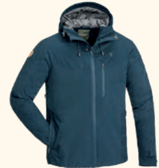
5300 FINNVEDEN HYBRID EXTREME JACKET M'S D.DIVE (349), BLACK/ D.ANTHRACITE (407), D.OLIVE/ H.OLIVE (723)