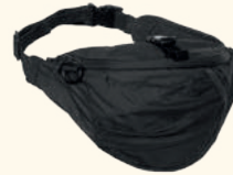
1915 PINWOOD® CROSS WAIST PACK 4L D.OLIVE (128), BLACK (400)