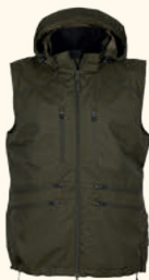
5180 PINWOOD® DOG SPORTS WINDBLOCKER VEST M'S MOSS GREEN (135), BLACK (400)