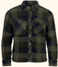
6063 FINNVEDEN CANADA FLEECE SHIRT K'S GREEN/BLACK (101)