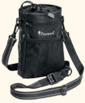
1106 PINWOOD® DOG SPORTS BAG SMALL BLACK (400)