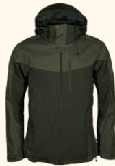
5303 FINNVEDEN HYBRID JACKET M'S D.OLIVE/H.OLIVE (723), BLACK (400), TERRACOTTA (524)