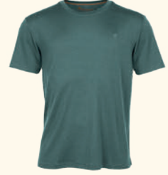
5345 PINWOOD® MERINO S/S T-SHIRT M'S ATLANTIC BLUE (374), GREEN (100), GREY (404)