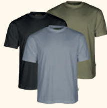
5447 PINWOOD® 3-PACK T-SHIRT M'S OLIVE/SHADOBLU/BLACK (750), GREEN/H.BROWN/KHAKI (720)