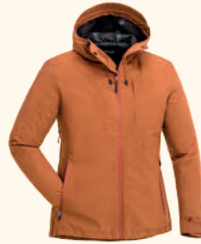
3213 ABISKO/TELLUZ 3L JACKET W'S MOSS GREEN (135), BURNED ORANGE (501), MARRON ROSE (597), D.ANTHRACITE (443)