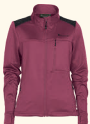
3209 ABISKO POWER FLEECE JACKET W'S MOSS GREEN (135), BLACK (400), URBAN GREY (460), PINK (507)