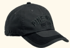
9195 PINewood® EXTREME CAP MOSS GREEN (135), D.ANTHRACITE/BLACK (446)