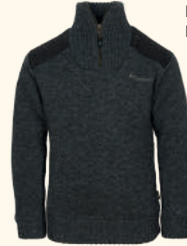
6648 PINEWOOD® HURRICANE SWEATER K'S D.GREY MEL (423), D.GREEN MEL (142)