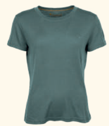
3345 PINWOOD® MERINO S/S T-SHIRT W'S ATLANTIC BLUE (374), GREEN (100), GREY (404)