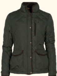
3815 NYDALA CLASSIC QUILT JACKET W'S MOSS GREEN (135)