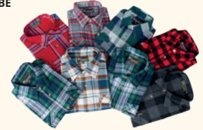
9126 PINWOOD® TEXAS SHIRT M'S MIX (000)