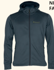
5319 FINNVEDEN HOODIE M'S MID KHAKI (248), TERRACOTTA (524), OLIVE (107), D.STORM BLUE (366), BLACK (400)