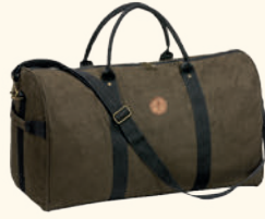
1907 PINWOOD® PRESTWICK EXCLUSIVE WEEKEND BAG SUEDEBROWN/BLACK (246)