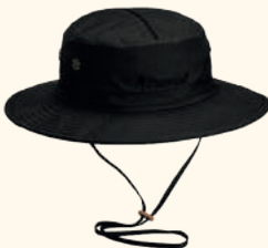
9478 PINewood® MOSQUITO HAT MOSS GREEN (135), D.OLIVE (128), L.KHAKI (224), BLACK (400)