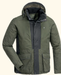
5183 PINWOOD® DOG SPORTS 2.0 JACKET M'S MOSSGREEN/BLACK (153), BLACK/D.ANTHRACITE (407)