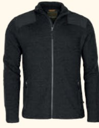
5396 PINWOOD® LAPPLAND FELTED WOOL JACKET M'S GREEN MEL (116), D.GREY MEL (423)