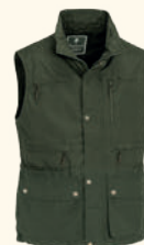
9288 PINWOOD® TIVEDEN VEST M'S MOSS GREEN (135), H.OLIVE (713), D.OLIVE (128), L.KHAKI (224), BLACK (400)