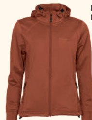
3319 FINNVEDEN HOODIE W'S MID KHAKI (248), D.STORM BLUE (366), TERRACOTTA (524), EARTH PLUM (815), OLIVE (107), BLACK (400), PINK (507)