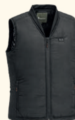
5590 PINWOOD® ULTRA BODY-HEAT VEST BLACK/GREY (412)