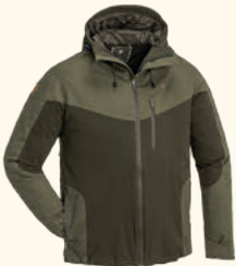
5300 FINNVEDEN HYBRID EXTREME JACKET M'S D.DIVE (349), BLACK/D.ANTHRACITE (407), D.OLIVE/H.OLIVE (723)