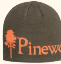
5897 PINWOOD® LOGO BEANIE GREEN/ORANGE (120), ORANGE/GREEN (542)