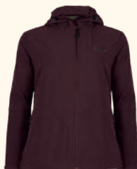
3317 FINNVEDEN TRAIL STRETCH JACKET W'S D.GREEN (103), BLACK (400), EARTH PLUM (815)