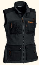
3081 PINEWOOD® DOG SPORTS VEST W'S D.ANTHRACITE/BLACK (446), MOSSGREEN/BLACK (153)