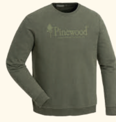
5778 PINWOOD® SUNNARYD SWEATER M'S GREEN (100), L.GREY MEL (454)