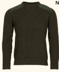
5486 PINWOOD® LAPPLAND ROUGH SWEATER M'S MOSSGREEN MEL (194)