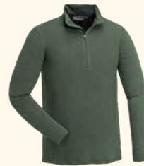
5406 ABISKO MERINO BASE LAYER HALF ZIP M'S SMOKE BLACK (437), D.MOSSGREEN (733)