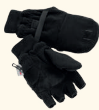
9109 PINewood® HUNTING/FISHING GLOVE H.GREEN (114), BLACK (400)