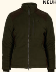
3064 PINWOOD® HARRIETTE PADDED FLEECE JACKET W'S GREEN/SUEDEBROWN (724)