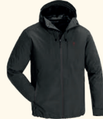
5213 ABISKO/TELLUZ 3L JACKET M'S MOSS GREEN (135), D.ANTHRACITE (443), BURNED ORANGE (501)