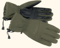
1127 PINWOOD® PADDED 5-FINGER GLOVE D.GREEN (103), BLACK (400)