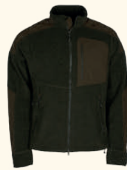
5894 SMÅLAND FOREST FLEECE JACKET M'S H.GREEN (114)