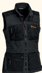
3081 PINWOOD® DOG SPORTS VEST W'S D.ANTHRACITE/BLACK (446), MOSSGREEN/BLACK (153)