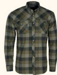
9525 PINWOOD® LUMBO SHIRT M'S OLIVE/SUEDE BROWN (189), GREEN/BLACK (101), RED/BLACK (518), TERRACOTTA/GREEN (540)