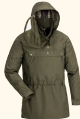
5095 PINWOOD® TIKAANI TC-STRETCH ANORAK M'S H.OLIVE (713)