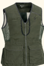
3184 PINWOOD® DOG SPORTS 2.0 VEST W'S L.KHAKI (224), MOSS GREEN (135), SUEDE BROWN/D.OLIVE (244), BLACK/D.ANTHRACITE (407), PLUM/D. ANTHRACITE (582)