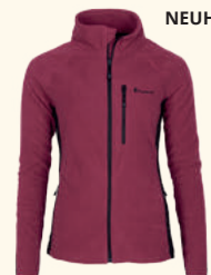
3248 PINWOOD® AIR VENT FLEECE JACKET W'S D.OLIVE (128), BLACK (400), D.MOSSGREEN (733), D.PINK (811), EARTH PLUM (815)