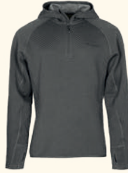
5516 EVERYDAY TRAVEL HOODIE M'S D.GREEN MEL (142), GREY MEL (408)