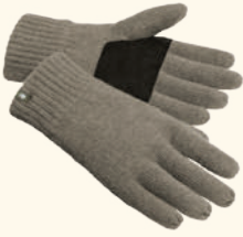
1122 PINWOOD® KNITTED WOOL 5-FINGER GLOVE MOLE MEL (234), STORM BLUE MEL (364), RUSTY PINK MEL (594), MOSSGREEN MEL (194), D.ANTHRACITE MEL (449)