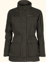
3394 PINWOOD® WILDMARK EXTREME JACKET W'S D.OLIVE (128)