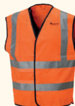
9220 PINWOOD® SAFETY VEST M'S HIGHVISUAL ORANGE (502)