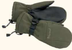
1126 PINWOOD® PADDED GLOVE D.GREEN (103), BLACK (400)