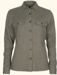
3005 PINEWOOD® VÄRNAMO OVERSHIRT W'S MOLE MEL (234), D.GREEN MEL (142)