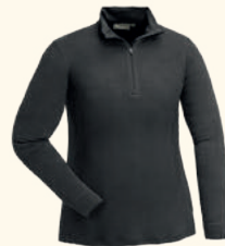
3406 ABISKO MERINO BASE LAYER HALF ZIP W'S SMOKE BLACK (437), D.MOSSGREEN (733)