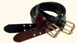
9097 PINWOOD® LEATHER BELT 40 MM BROWN (205), BLACK (400)