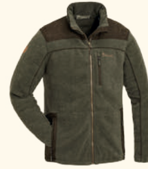
5067 PINWOOD® PRESTWICK EXCLUSIVE FLEECE JACKET M'S OLIVE MEL/SUEDE BROWN (702)