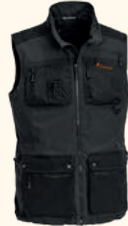
5081 PINEWOOD® DOG SPORTS VEST M'S D.ANTHRACITE/BLACK (446), D.OLIVE/SUEDE BROWN (186)