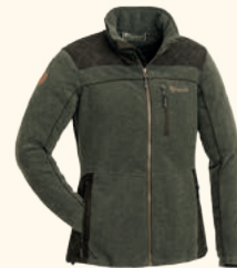
3067 PINWOOD® DIANA EXCLUSIVE FLEECE JACKET W'S OLIVE MEL/SUEDE BROWN (702)