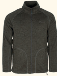
9772 PINWOOD® GABRIEL KNITTED JACKET M'S OLIVE MEL (148)