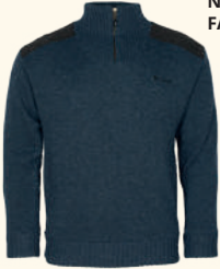
9648 PINWOOD® HURRICANE SWEATER M'S D.NAVY MEL (378), D.GREEN MEL (142), BROWN MEL (207), D.GREY MEL (423)