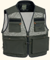
5059 PINewood® ACTIVE FISHING VEST M'S D.GREEN (103)