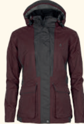
3183 PINWOOD® DOG SPORTS 2.0 JACKET W'S EARTHPLUM/D.ANTHRACITE (817), MOSSGREEN/BLACK (153), BLACK/D.ANTHRACITE (407)