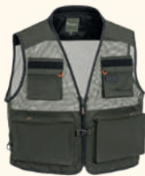
5059 PINWOOD® ACTIVE FISHING VEST M'S D.GREEN (103)