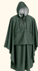
9163 PINEWOOD® GUSTAV PONCHO GREEN (100), GREEN/ORANGE (120)