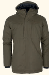
5414 PINWOOD® VÄRNAMO PADDED JACKET M'S EARTH BROWN (206), D.GREEN (103), SMOKE BLACK (437)