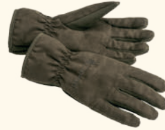
1501 PINWOOD® EXTREME SUEDE PADDED GLOVE SUEDE BROWN/ D.OLIVE (244)