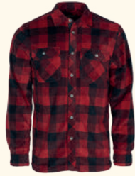
5063 FINNVEDEN CANADA FLEECE SHIRT M'S GREEN/BLACK (101), RED/BLACK (518)