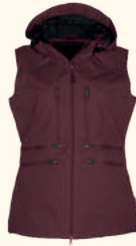
3180 PINEWOOD® DOG SPORTS WINDBLOCKER VEST W'S URBAN GREY (460), EARTH PLUM (815), MOSS GREEN (135), BLACK (400), MARRON ROSE (597)