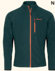
5248 PINWOOD® AIR VENT FLEECE JACKET M'S D.OLIVE (128), D.ATLANTIC BLUE (377), BLACK (400), D.MOSSGREEN (733)