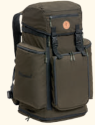
1910 PINWOOD® WILDMARK CHAIR BACKPACK SUEDE BROWN (241)