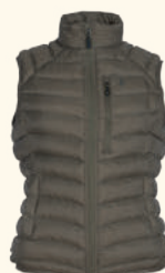
3158 ABISKO INSULATION VEST W'S D.MOLE BROWN (260), SMOKE BLACK (437), MARRON ROSE (597), CLOVER GREEN (735)