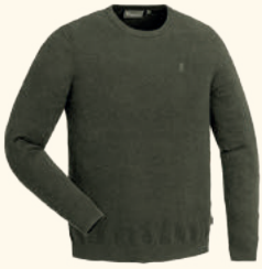
5049 PINWOOD® VÄRNAMO CREWNECK KNITTED SWEATER M'S GREEN MEL (116), BROWN MEL (207), MOLE MEL (234), D.COPPER MEL (557)