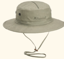
9478 PINWOOD® MOSQUITO HAT MOSS GREEN (135), D.OLIVE (128), L.KHAKI (224), BLACK (400)