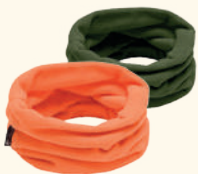
9105 PINWOOD® FLEECE COLLAR GREEN (100), HIGHVISUAL ORANGE (502)