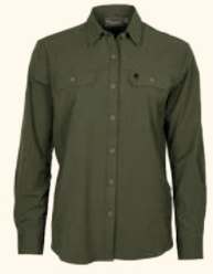
3342 EVERYDAY TRAVEL L/S SHIRT W'S GREEN (100), SAND (200)