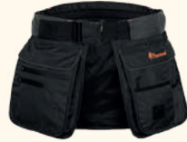
1141 PINEWOOD® DOG SPORTS UTILITY BELT MOSSGREEN/BLACK (153), BLACK/D.ANTHRACITE (407)