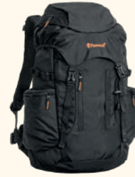
1909 PINWOOD® SCANDINAVIAN OUTDOOR LIFE BACKPACK BLACK (400)