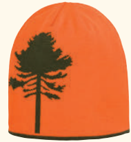
9124 PINWOOD® TREE - REVERSIBLE HAT ORANGE/GREEN (542)