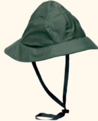
9113 PINewood® SOUTHWEST HAT GREEN (100)