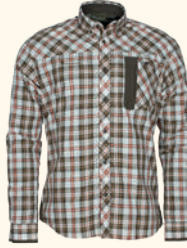
5329 PINWOOD® WOLF SHIRT M'S D.GREEN (103), OFFWHITE/BROWN (611)