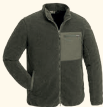
5206 PINWOOD® PILE JACKET M'S D.GREEN (103), D.NAVY (314)