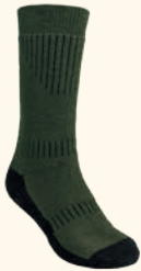
9500 PINWOOD® DRYTEX SOCK MIDDLE GREEN/D.BROWN (174)