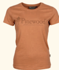
3445 PINWOOD® OUTDOOR LIFE T-SHIRT W'S L.TERRACOTTA (514), H.OLIVE (713), D.ANTHRACITE (443)