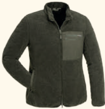
3206 PINWOOD® PILE JACKET W'S D.GREEN (103), D.NAVY (314)