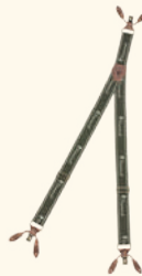
1116 PINWOOD® SUSPENDERS LOGO 2.0 D.OLIVE (128)