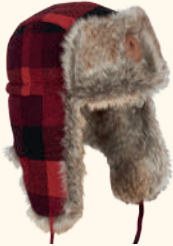
1420 PINWOOD® CLASSIC CHECKED FUR HAT GREEN/BLACK (101), RED/BLACK (518)