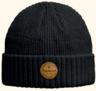
1110 PINWOOD® WINDY HAT MOSS GREEN (135), BLACK (400), ORANGE (504)