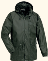
5001 PINEWOOD® GREMISTA RAIN JACKET M'S GREEN (100)