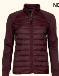
3241 FINNVEDEN HYBRID POWER FLEECE JACKET W'S OLIVE (107), BLACK (400), EARTH PLUM (815)