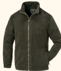
9495 PINWOOD® RETRIEVER FLEECE JACKET M'S D.OLIVE/SUEDE BROWN (186)