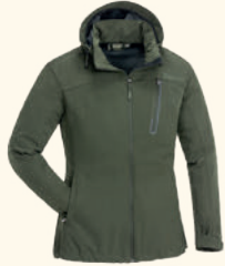
3141 PINEWOOD® WILDA STRETCH SHELL JACKET W'S MOSS GREEN (135), BLACK (400)