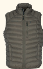
5158 ABISKO INSULATION VEST M'S D.MOLE BROWN (260), SMOKE BLACK (437), CLOVER GREEN (735)