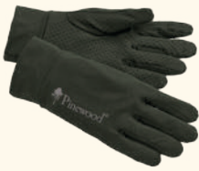
9405 PINWOOD® THIN LINER GLOVE MOSS GREEN (135)