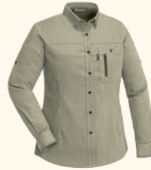
3016 TIVEDEN TC-STRETCH NATURESAFE SHIRT W'S L.KHAKI (224), D.OLIVE/SUEDE BROWN (186)