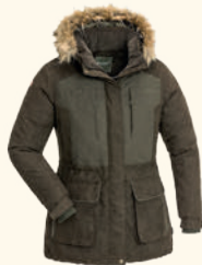
3884 PINWOOD® ABISKO 2.0 JACKET W'S SUEDE BROWN (241)