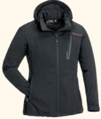
3141 PINWOOD® WILDA STRETCH SHELL JACKET W'S MOSS GREEN (135), BLACK (400)