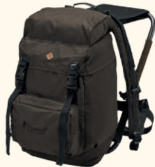
9613 PINWOOD® HUNTING CHAIR BACKPACK SUEDE BROWN (241)