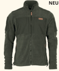
5488 PINWOOD® LAPPLAND ROUGH FLEECE JACKET M'S OLIVE MEL/D.OLIVE (752)