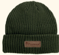
5217 PINWOOD® NEW STÖTEN HAT GREEN (100), BLACK (400), ORANGE (504), WHITE (600)