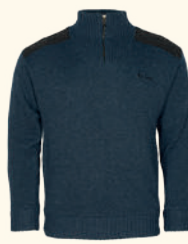
9648 PINewood® HURRICANE SWEATER M'S D.NAVY MEL (378), D.GREEN MEL (142), BROWN MEL (207), D.GREY MEL (423)