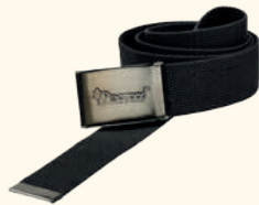
9199 PINWOOD® CANVAS BELT OLIVE (107), BEIGE (204), BROWN (205), BLACK (400)