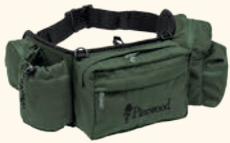
9606 PINWOOD® RANGER WAISTBAG MOSS GREEN (135)