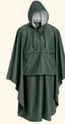
9163 PINewood® GUSTAV PONCHO GREEN (100), GREEN/ORANGE (120)